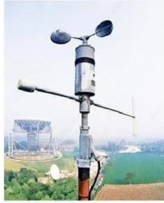
પવનની ગતિ માપતું યંત્ર.

30 કિમીથી વધુની ઝડપે પવન ફૂંકાશે તો અમદાવાદ-મુંબઈ વચ્ચે દોડનારી બુલેટ ટ્રેન ઓટોમેટિક બંધ થઈ જશે. કારણ કે, બુલેટ ટ્રેનના ટ્રેક પર તાપી નદીના બ્રિજ પર એનેમોમીટર સેન્સર લગાડ્યા છે. દરિયા કાંઠાના સ્થળોએ વાવાઝોડાની સાથે ધોધમાર વરસાદ પડે છે. આ ઉપરાંત તાપમાન પણ ખૂબ જ વધી જાય છે. આવી સ્થિતિમાં બુલેટ ટ્રેનનું ઓપરેશન કરવું જોખમી ગણાય છે, જેથી નેશનલ હાઈ સ્પીડ કોરિડોર